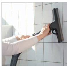
Mit der Wand- und Fensterdüse erstrahlen Fliesen im neuen Glanz – wie neu.