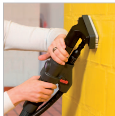
Die Wanddüse schmal reinigt auch poröse Flächen, für kleine Flächen geeignet.