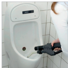
Mit der Dampfstrahldüse gebogen erreichen Sie jede Verschmutzung.