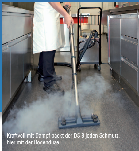
Kraftvoll mit Dampf packt der DS 8 jeden Schmutz, hier mit der Bodendüse.