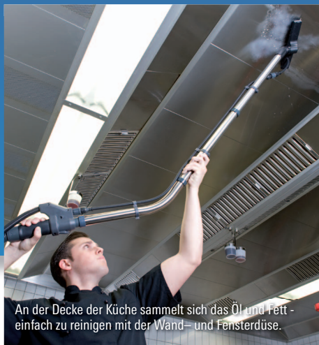
An der Decke der Küche sammelt sich das Öl und Fett - einfach zu reinigen mit der Wand- und Fensterdüse.