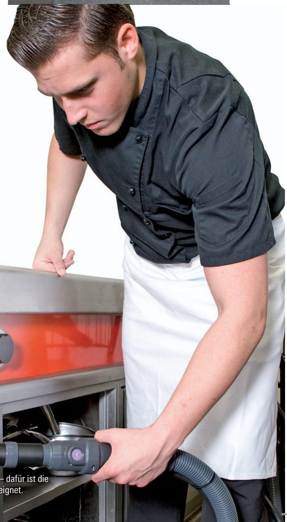
Abluftfilter sind schwierig zu reinigen – dafür ist die Dampfstrahldüse gebogen bestens geeignet.