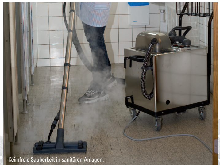
Keimfreie Sauberkeit in sanitären Anlagen.