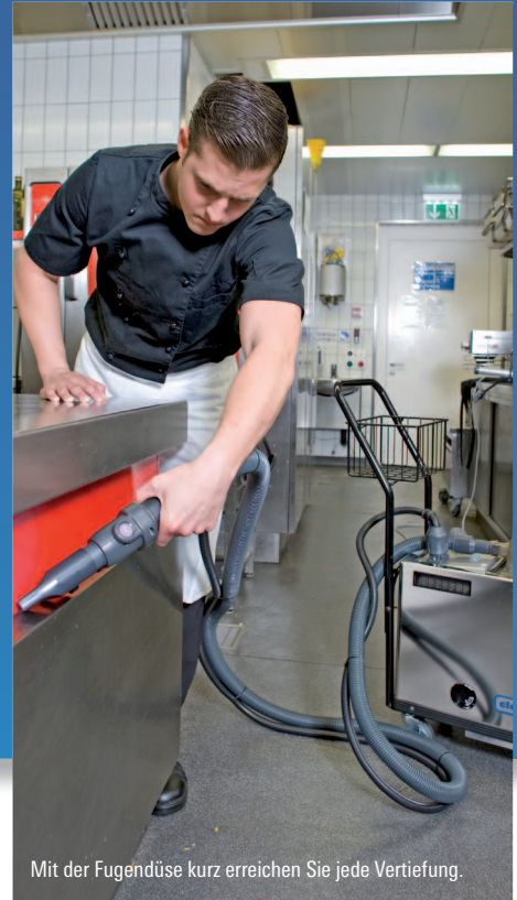
Mit der Fugendüse kurz erreichen Sie jede Vertiefung.

Auch für Lebensmittelindustrie, Schwimmbäder, Wellnessbereiche und Sportanlagen unentbehrlich.