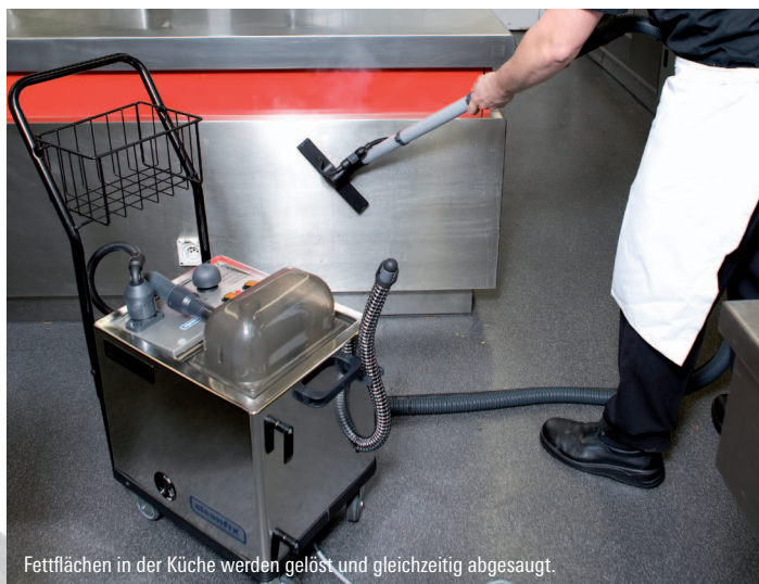
Fettflächen in der Küche werden gelöst und gleichzeitig abgesaugt.